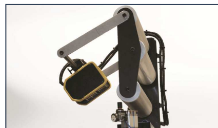
Stroboskop mit verlängerter Bahnführung