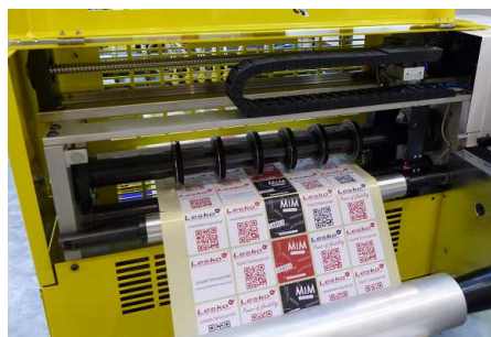
Längsschneider mit vollautomatisch positionierbaren Scherenschnitt-Klingen