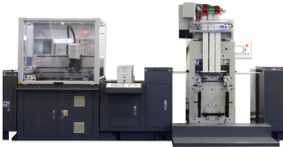
Link Finishing Ausschnitt Siebdruck + Heißfolie

Mit dem Querschneider ISH 330 B kommt die hochproduktive Lösung zum vereinzeln von Rollenetiketten auf Bogen.