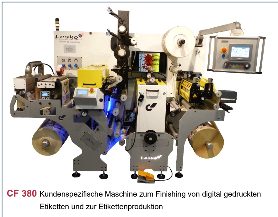
CF 380 Kundenspezifische Maschine zum Finishing von digital gedruckten Etiketten und zur Etikettenproduktion